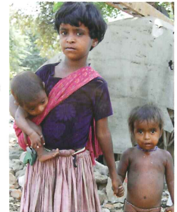
Millionen von Kindern leben auf der Straße ohne Essen, ohne Kleider. In unseren Feed the Poor Centern bekommen die Straßenkinder eine nährreiche Mahlzeit. Arme Familien bekommen einen Eimer Reis und andere Nahrungsmittel.