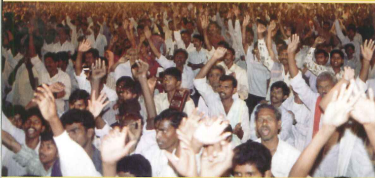
Die Unerreichten mit dem Evangelium erreichen und Großevangelisationen, Straßeneinsätze und persönliche Evangelisationen durchführen.