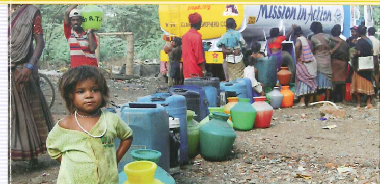
Wir bohren Brunnen in Dörfern und verteilen sauberes Trinkwasser in den Slums, besonders dort, wo Wasser sehr wertvoll und schwer zu finden ist.