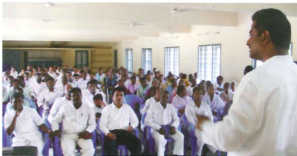
Pastoren und Leiter lehren und ausbilden, um starke Ortsgemeinden zu bauen.