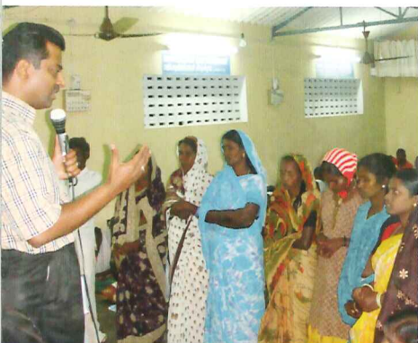
Neue Gemeinden in Dörfern und entlegenen Orten in Indien und anderen Ländern gründen.