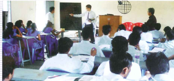
Bibelcollege: Starke Männer und Frauen heranbilden, die für den Herrn Jesus in den Vollzeitdienst gehen und das Wort Gottes ohne Kompromisse und mit Salbung predigen.