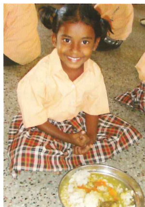
Uns um Waisenkinder kümmern, ihnen ein Zuhause, drei Mahlzeiten am Tag, Kleidung, medizinische Versorgung und Bildung geben. Sie wachsen in einer Atmosphäre der Liebe und Hoffnung auf. Wir helfen ihnen, eine bessere Zukunft zu haben und ihre gottgegebene Bestimmung zu erfüllen.