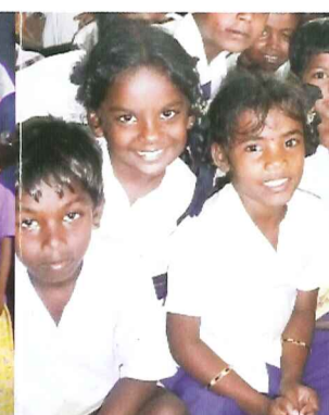
Entrechteten Kindern helfen, indem wir sie aus Kinderarbeit retten, ihnen eine gute Schulbildung geben und sie biblische Grundsätze lehren. Bildung ermöglicht den Kindern, ihre Träume zu verwirklichen, und unterbricht den Kreislauf des Analphabetismus und der damit einhergehenden Armut.